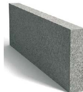
Tablica 1. Wymiary obrzeży.

2. Obrzeże jednostronnie fazowane o wymiarach: 8×25×100 cm, (1mb/43kg) 8×30×100 cm, (1mb/52kg)